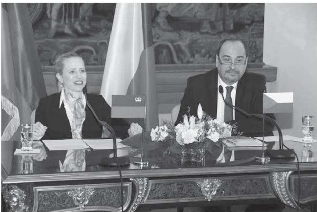
Ministr zahraničí České republiky Jan Kohout a ministryně zahraničí Lichtenštejnska Aurelia Frick při setkání ministrů zahraničí s Česko-lichtenštejnskou komisí historiků dne 13. ledna 2014