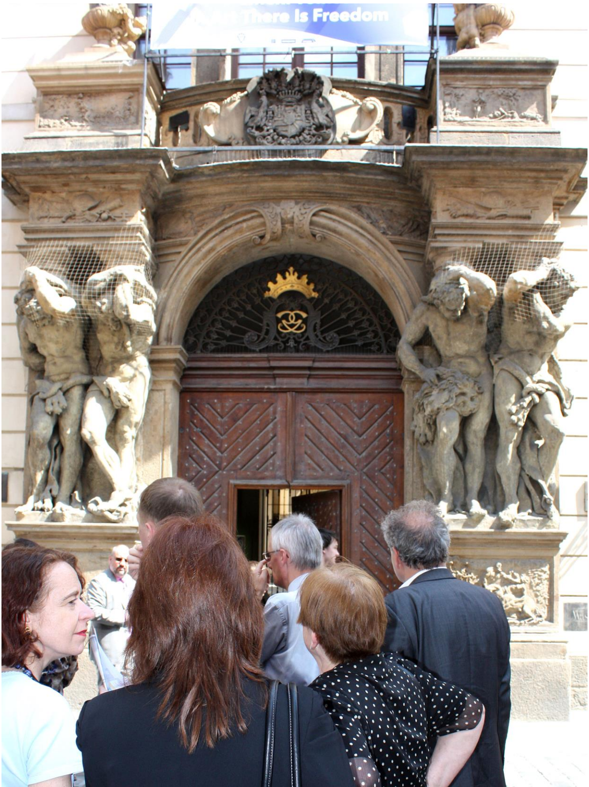
Workshop Die Liechtenstein im 20. Jahrhundert