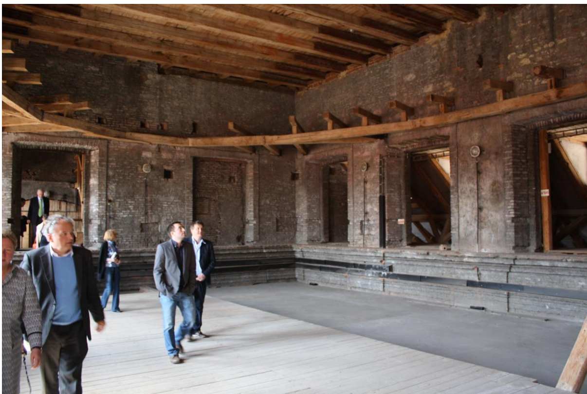
Prohlídka prostor Clam-Gallasova paláce