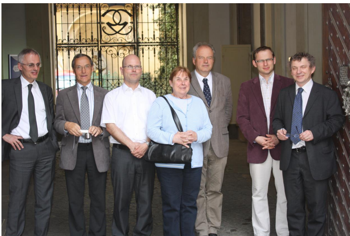
Zasedání Česko-lichtenštejnské komise historiků